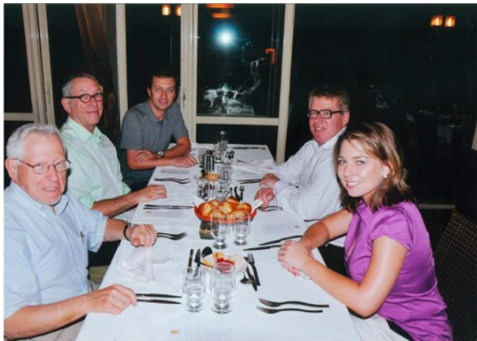
Встреча Правления и персонала в Дакаре.

Участие в конференциях ICANN — один из важнейших аспектов моей работы. Общение с людьми через интернет дает удовлетворительные результаты, однако иногда сложно выстроить хорошие рабочие взаимоотношения без личных встреч со своими коллегами. Для меня конференции ICANN важны при обеспечении того, чтобы Отдел омбудсмана рассматривался как заслуживающая доверия система разрешения споров. Как правило, создается впечатление, что в присутствии омбудсмана есть необходимость, и на каждой конференции я выполняю существенный объем посреднической работы. Кроме того, по мере того как все больше людей узнает о моем существовании, в мой кабинет приходит все больше посетителей. Возможно это медленный процесс, однако я надеюсь, что по мере роста моего престижа в сообществе, мне удастся приобрести репутацию доступного и полезного человека. Я также встречаюсь с новыми сотрудниками ICANN и провожу занятия, на которых они знакомятся с функцией омбудсмана. Это обязательное для персонала, но замечательное мероприятие, поскольку я знакоблюсь с очень многими новыми сотрудниками, что является большой честью.