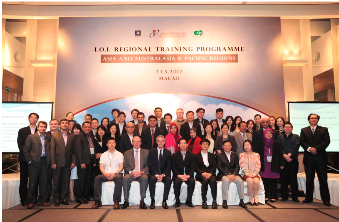
Обучение в Макао с коллегами из IOI.